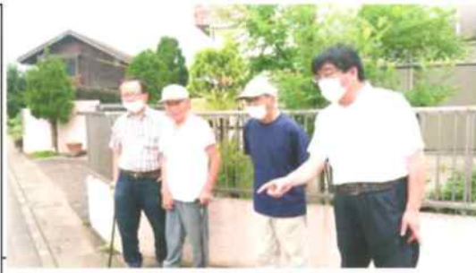
対話と現場主義を貫く!

【主な活動報告】(2019 ~ 2023年) ■住民要望40年の取り組み「西大久保」交差点に信号機設置しました! 西入間警察に陳情、署名は4525筆、総工事費約2億円。 ■住宅地に「産廃」が持ち込まれる。住民が団結し(武内県議も応援)、裁判に勝利する。 ■ゲリラ豪雨で葛川8号橋が崩落、自治会と町にかけ替えを強く要望。12月復旧する。 ■葛川の護岸を1mかさ上げ実現・市場地内 ■第22回「原爆絵画展」に協賛「反核・平和の火リレー」に参加 ■子ども食堂への支援。