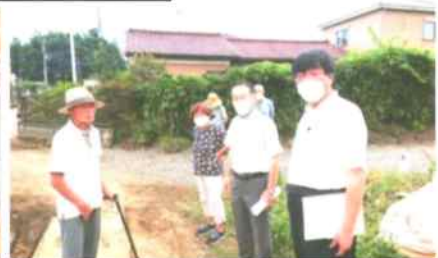
住宅地に「産廃」住環境が悪化 産廃業者と裁判し、勝利する