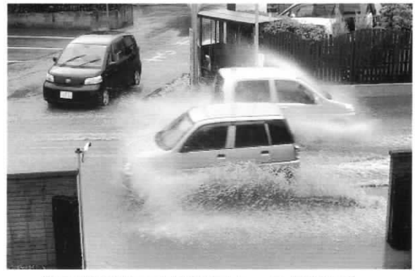
【玉林寺地区の県道冠水 7月20日】 「早期に改善を！」飯能県土事務所へ!