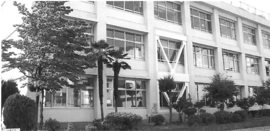
耐震化で安心安全な学校生活を!! (毛呂山小学校)