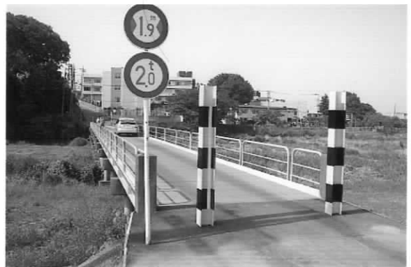
【多和目橋】改修工事で車幅が狭く規制、騒音も大きくなった。直ちに坂戸市役所へ!