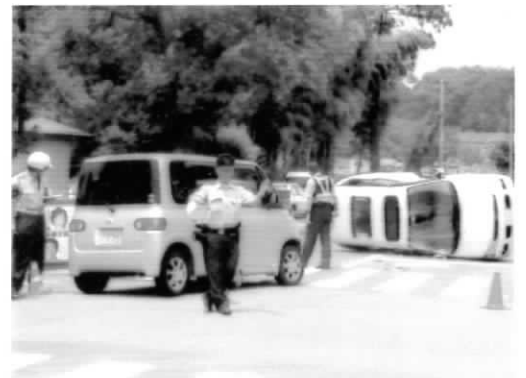
早期に信号機設置を! (西大久保地区)