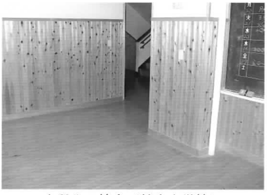
木質化の校舎 (越生中学校)